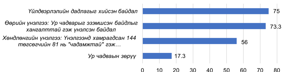
Зураг 4. Мөшгих судалгаанд хамрагдагчдын ур чадварын зөрүү

Дээрх мөшгих судалгаанд хамрагдагчдын 73.3 хувь нь өөрийн эзэмшсэн ур чадвараа хангалттай гэж үнэлсэн бол үнэлгээнд хамрагдсан 144 төгсөгчийн 81 нь буюу 56 хувь нь чадамжтай гэж хөндлөнгийн үнэлгээгээр үнэлсэн байна. Эндээс ур чадварын зөрүүг 17.3 хувиар зөрүүтэй гэж үнэлсэн байна.