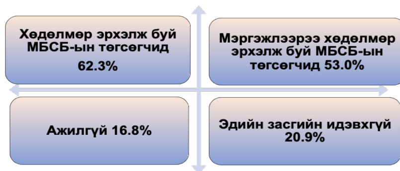
Зураг 2. МБСБ төгсөгчдийн эдийн засгийн идэвх /2018 он/

Дээрх судалгаанаас харахад суралцагчдыг зах зээлийн эрэлт хэрэгцээнд нийцүүлэн бэлтгэх чиг үүргийн хэрэгжилт хангалтгүй, ажлын байрны шаардлагад нийцүүлсэн чанартай боловсон хүчин дутагдалтай байгааг харж болно.